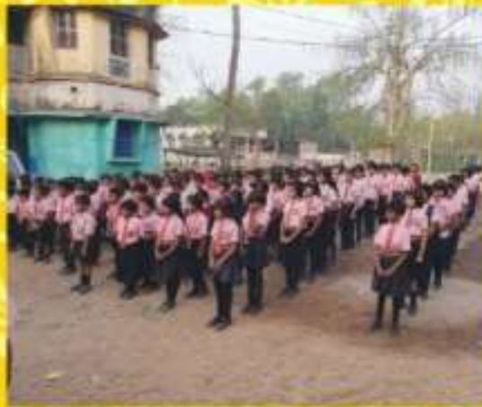
অ্যাসেম্বলিতে বিদ্যালয়ের ছাত্র/ছাত্রীরা