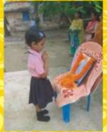
গান্ধী জয়ন্তী উদযাপন