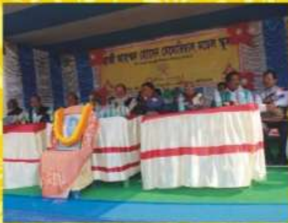
নেতাজী জন্মদিবস উদযাপন