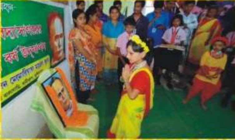
ঈশ্বরচন্দ্র বিদ্যাসাগর জন্ম জয়ন্তী উদযাপন