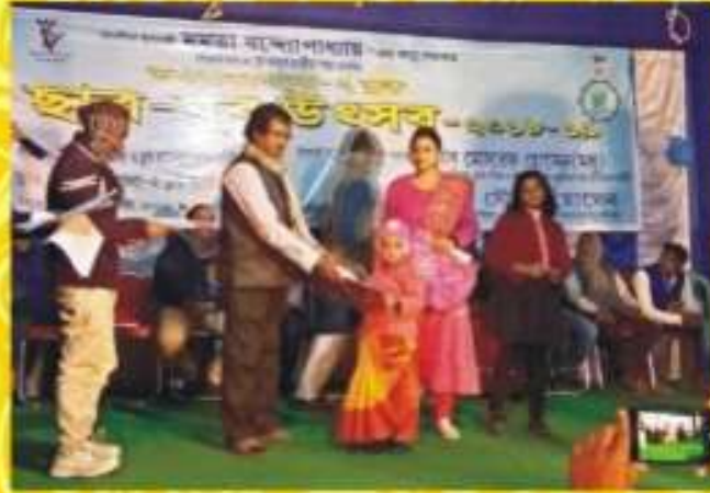
ছাত্র-যুব উৎসবে রবীন্দ্র সঙ্গীতে প্রথম স্থান অধিকারিণী