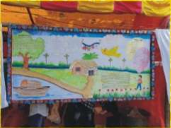
বিদ্যালয়ের দেওয়াল পত্রিকা "নক্ষত্র"