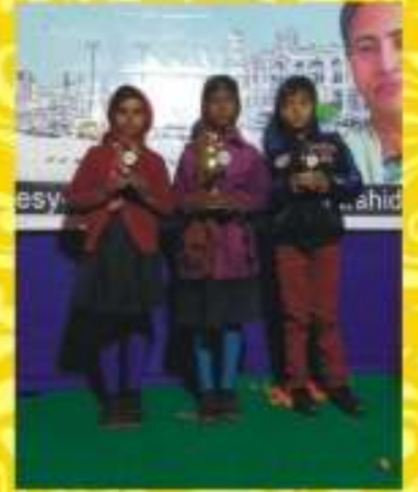
রানীতলা থানা আয়োজিত অন্ধন প্রতিযোগিতায় ১ম ২য় ওয় স্থান অধিকারী/অধিকারিণী