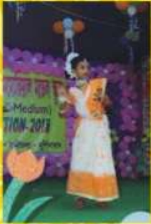
বিদ্যালয়ের বার্ষিক সাংস্কৃতিক অনুষ্ঠানে নৃত্য ও মুখাভিনয় পরিবেশন