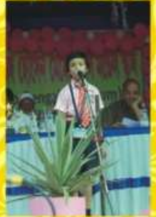
বিদ্যালয়ের বার্ষিক সাংস্কৃতিক অনুষ্ঠানে আবৃত্তি পরিবেশন