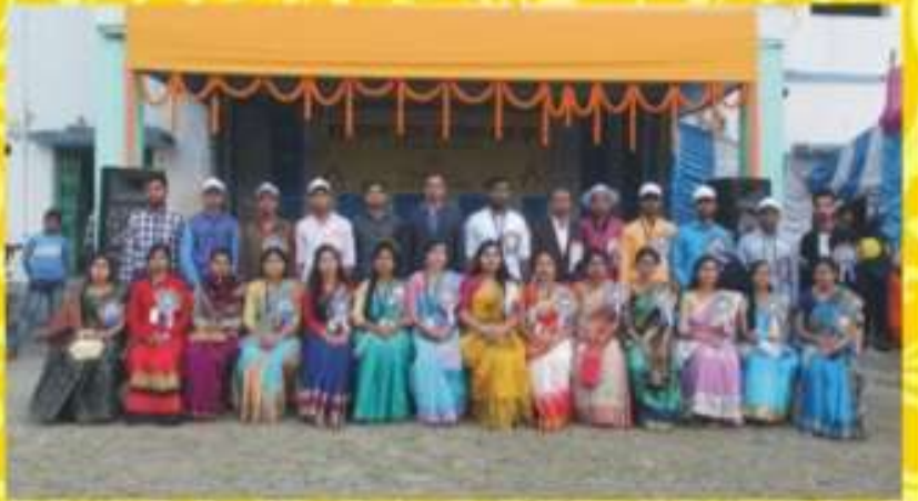
বিদ্যালয়ের শিক্ষক / শিক্ষিকা