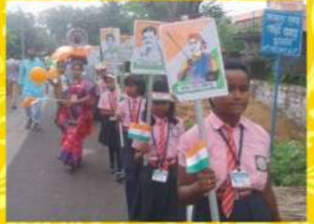
স্বাধীনতা দিবস উপলক্ষ্যে প্রভাতফেরি