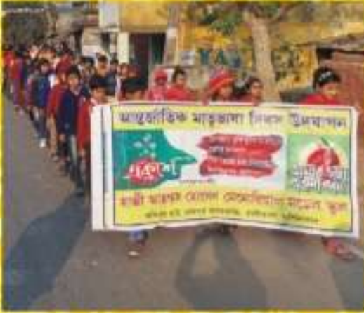
আন্তর্জাতিক মাতৃভাষা দিবস উদযাপন