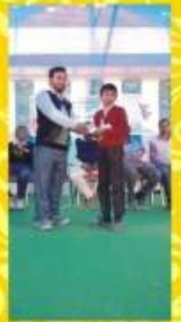
বিবেক চেতনা উৎসবে অন্ধন প্রতিযোগিতায় প্রথম স্থান অধিকারী