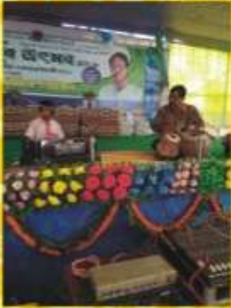
ছাত্র-যুব উৎসবে সঙ্গীত প্রতিযোগিতায় অংশগ্রহণ